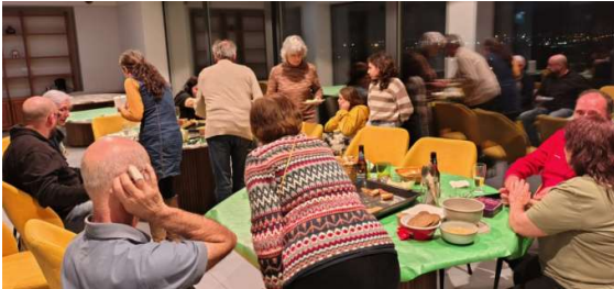
Merienda en Cohousing Axuntase- Oviedo

En Axuntase ya están habitando en la cooperativa desde octubre pasado, de manera que las compas pudieron compartir las primeras experiencias de vivir en comunidad.