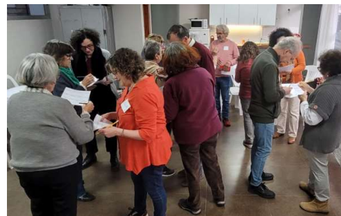
Taller de Ingreso, octubre 2023

Por ello hemos abierto la posibilidad para que personas que no residan en el país puedan integrarse a Carpe Diem, ya que desde el Instagram #cohabitarcarpediem nos escriben muchas personas que están dispuestas a sumarse a nuestro sueño. Muchos uruguayos en el exterior próximos a jubilarse y con ganas de volver al paisito, así como latinoamericanos de varias nacionalidades, han completado formularios para convertirse en aspirantes a ingresar.